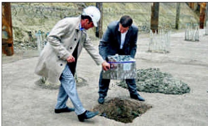
Die Bauherrschaft setzt die Kiste ins Fundament des «Hard Turm Park». (12. 5. 2011)